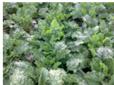
Parcela č.1 Neošetrené