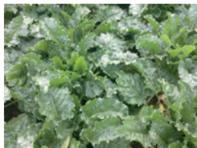
Parcela č.1 Ošetrené