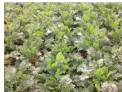
Parcela č.2 Neošetrené