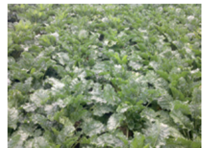
Parcela č.2 Ošetrené