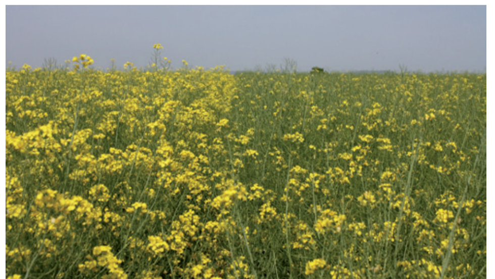
Viditeľný rozdiel v skorosti z hľadiska kvitnutia. Ľavá strana ES MOMENTO, pravá ANNISTON.