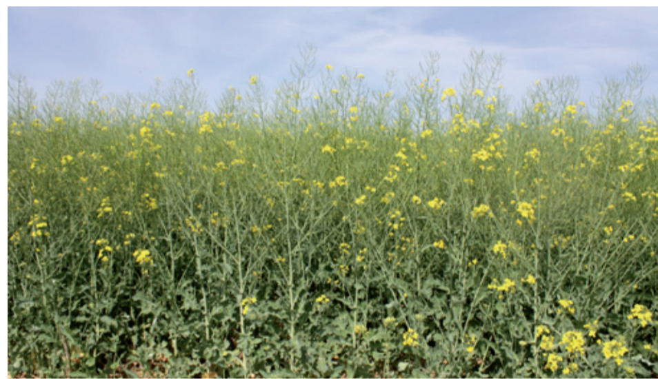
ANNISTON vo fáze odkvitania, 3. 5. 2018, lokalita Borovce.